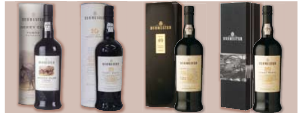
Balení v tubusu -10 Years Old Tawny, obal: T