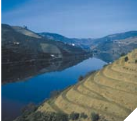
údolí řeky Douro

Portugalsko se z hlediska vinařství rozděluje do několika přísně vymezených oblastí. Každá oblast se vyznačuje svojí jedinečností, která je dána půdním složením a klimatickými podmínkami. Portugalské vinařství je založeno na pěstování tradičních portugalských vinných rév a zajištění typických vlastností vín podle geografického původu.