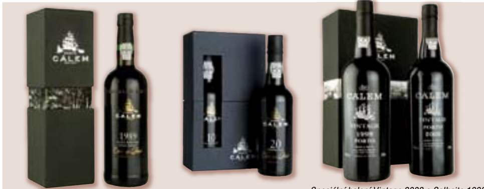
Balení v papírové krabičce vertikální -ukázka možnosti obalu, obal: PK 2