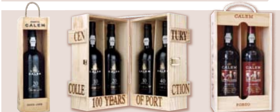
Balení v dřevěné krabičce -ukázka možnosti obalu, obal : DK