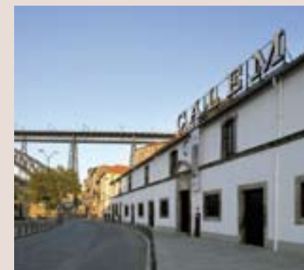
sklepy CÁLEM, Porto

Od roku 2006 došlo k fúzi obou tradičních sklepů A.A.CÁLEM a BURMESTER s mezinárodní společností Sogevinus Group, která v tomto roce získala čtvrtou pozici mezi největšími producenty portských vín na světě. Produkty obou značek získaly a získávají řady světových ocenění a uznání.