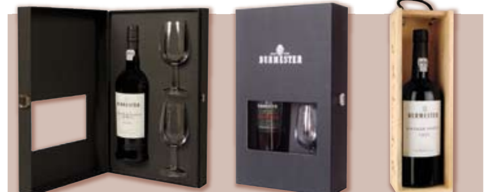
Late Bottled Vintage 2001 s dvěma skleničkami ve speciálním dárkovém boxu