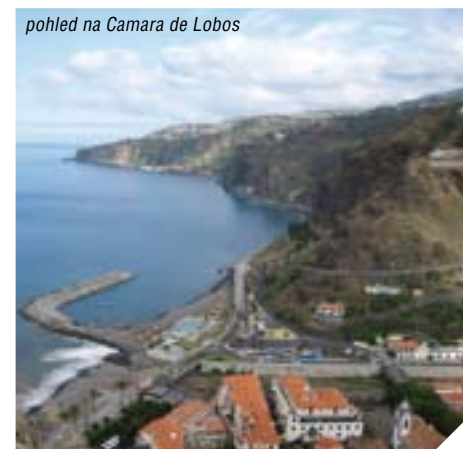
pohled na Camara de Lobos