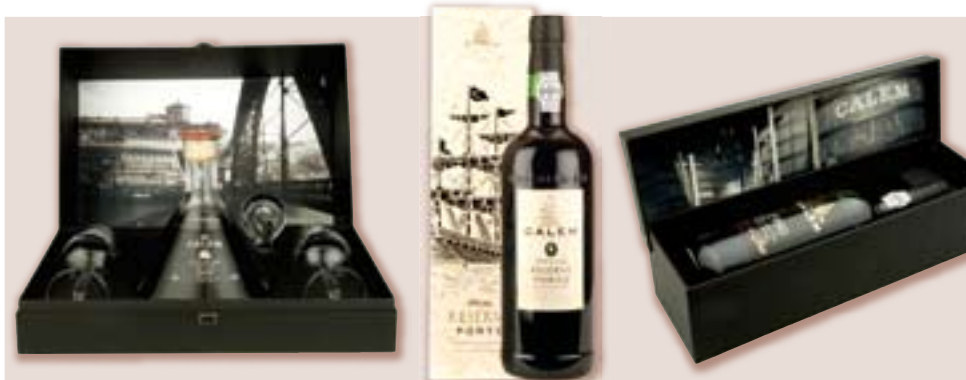
10 Years Old Tawny ve skleněném dekantéru, zabroušená zátka a dvě skleničky ve speciálním boxu