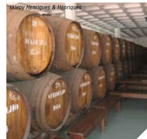
sklep Henriques & Henriques